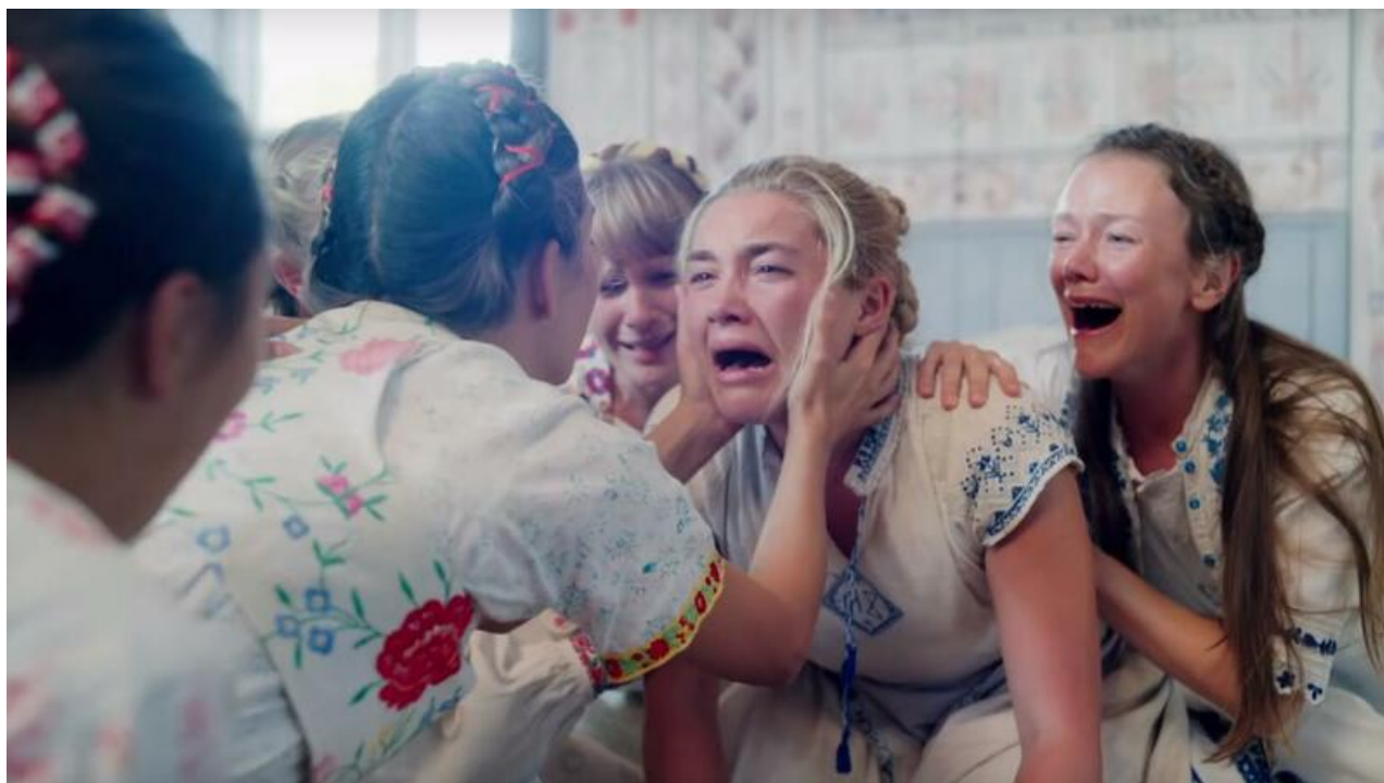
Midsommar - O Ritual, de Ari Aster.

O Cinema São Jorge, morada cativa do MOTELX, volta a abrir portas ao que de mais assustador anda por aí, dentro do seu género de eleição. O primeiro dos dois convidados de honra deste ano, Ari Aster - nome que ficou na moda depois da primeira longa-metragem, Hereditário -, vem a Lisboa, não só na qualidade de nova voz autoral, para dar uma masterclass (dia 15, 17.30), mas também para apresentar o seu último e tão aguardado filme, Midsommar - O Ritual (dia 13, 21.00). Esse que vai procurar a fibra do medo a uma comunidade sueca, em jeito de estudo antropológico, lançando um jovem casal num crescente feitiço macabro.